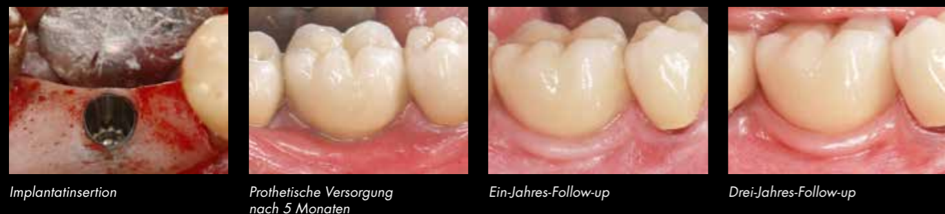
Implantatinsertion Prothetische Versorgung nach 5 Monaten Ein-Jahres-Follow-up Drei-Jahres-Follow-up